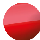
S. metalická Červená Sunrise Red 18 000 Kč