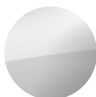
Standardní Bílá Arctic White