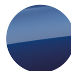
Metalická Modrá Royal Blue 15 000 Kč