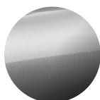
Metalická Šedá Volcanic Grey 15 000 Kč