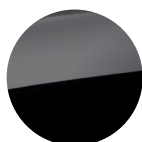
Metalická Černá Onyx Black 15 000 Kč